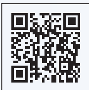
Video istruzioni di montaggio NAVP